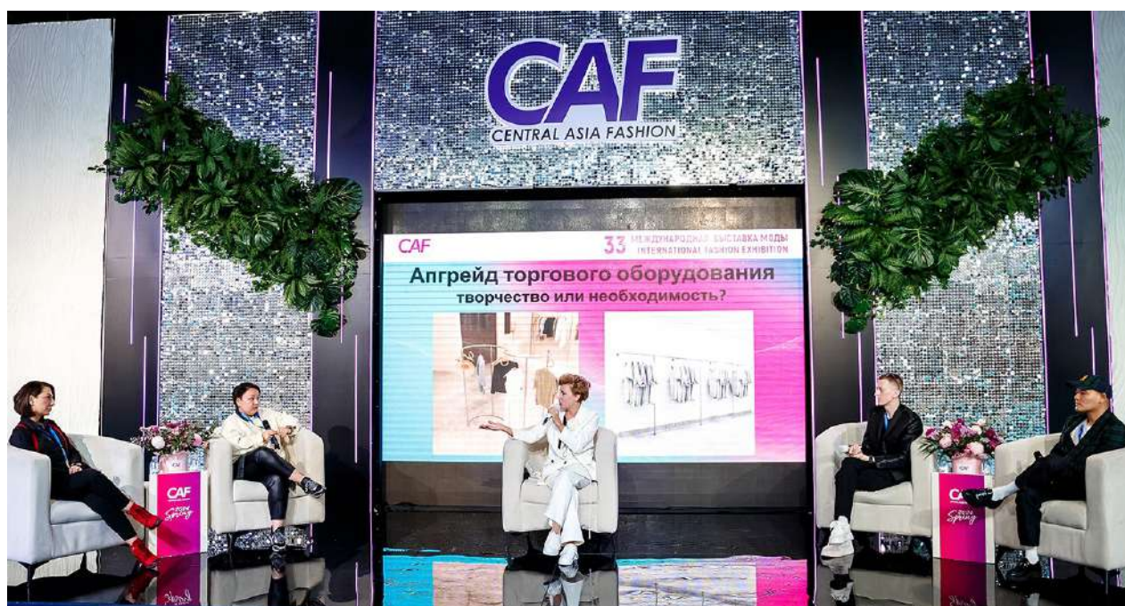
Бизнес-конференция Central Asia Fashion не имеет аналогов в Центральной Азии

В новом сезоне бизнес-конференции, в течение всех трех дней выставки пройдут 24 сессии, на которых выступят 13 авторитетных спикеров из Казахстана, России, Узбекистана и Нидерландов. В их числе впервые заявлены зарубежные эксперты по брендингу, неймингу, фандрайзингу, мерчандайзингу, архетипам, аналитик-исследователь из Узбекистана, а также топовый российский эксперт - автор книг и скриптов по продажам на fashion рынке. Среди главных тем бизнес-конференции - ритейл-тренды в категории fashion, рекомендации по выходу на рынок Узбекистана, разбор хайповых мировых трендов в бизнесе, особенности национального сервиса и фидбека Жана Казахстан, цифровые и e-сom инновации для ритейла, специфика продвижения модных брендов в социальных сетях, тренды, влияющие на общество и бизнес, ребрендинг в ритейле и модном бизнесе и многое другое.