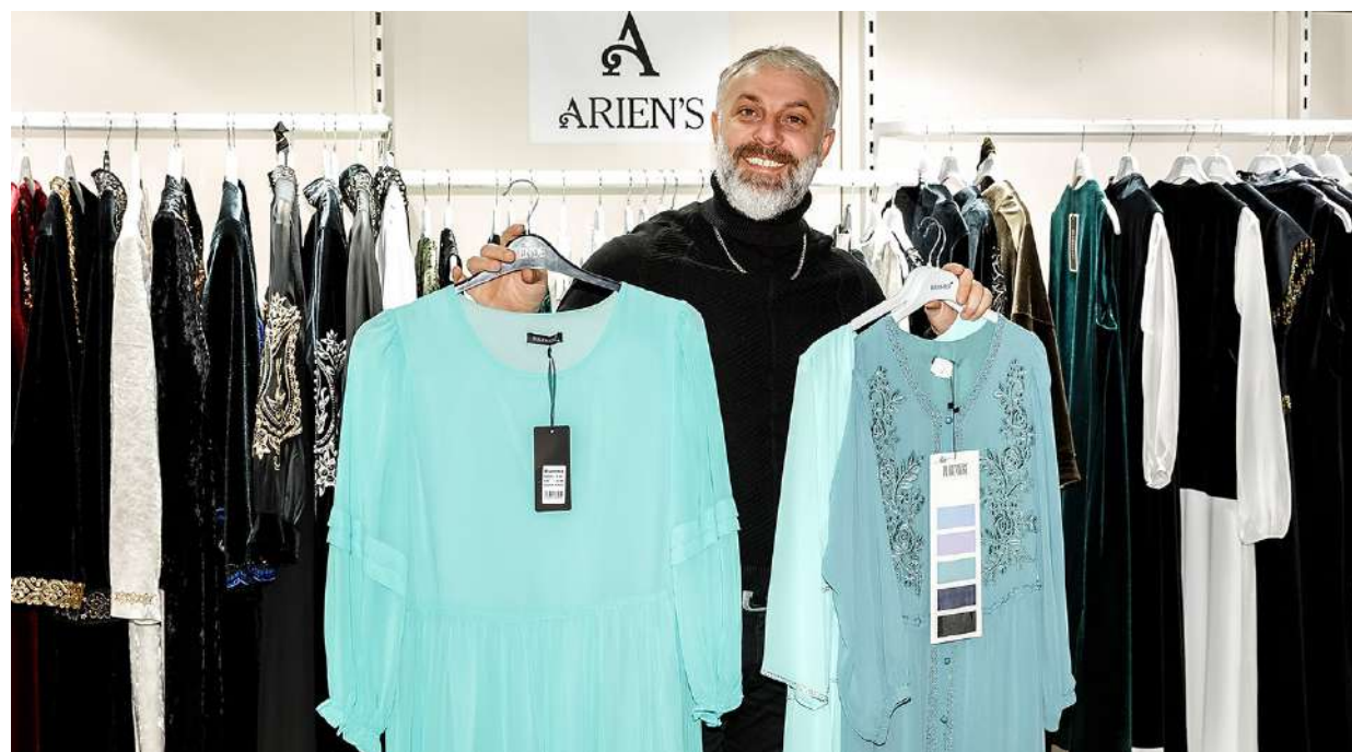
CAF проходит в формате B2B только для профессионалов fashion индустрии

Jeans – один из крупнейших производителей джинсовой одежды на рынке Ближнего Востока и Южной Азии из ОАЭ - расширяет свою экспортную зону, участвуя в CAF. Польская компания по производству головных уборов NIKOLA HATS представит новую коллекцию шляп для всех возрастных групп. Известный французский бренд LA FEE MARABOUTEE выбрал для показа своих роскошных коллекций именно крупнейшую выставку моды в Центральной Азии. Такое же решение приняла известная монгольская компания по производству кашемира DELICASHMERE.