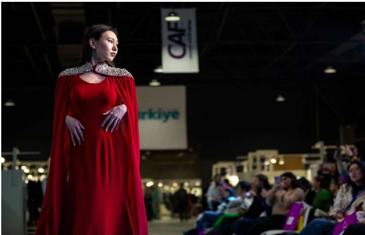
Компании-участники демонстрируют свои коллекции на подиуме-трансформере

Все три дня в рамках проведения CAF действуют деловые и нетворкинг зоны, шоурумы, проходит шоу-программа, презентации брендов и модные показы с участием профессиональных моделей. На Central Asia Fashion Autumn-2024 пройдет серия модных показов компаний-участников. Посетители увидят новые коллекции одежды, обуви и мехов. Также пройдет показ дизайнера одежды из Казахстана.